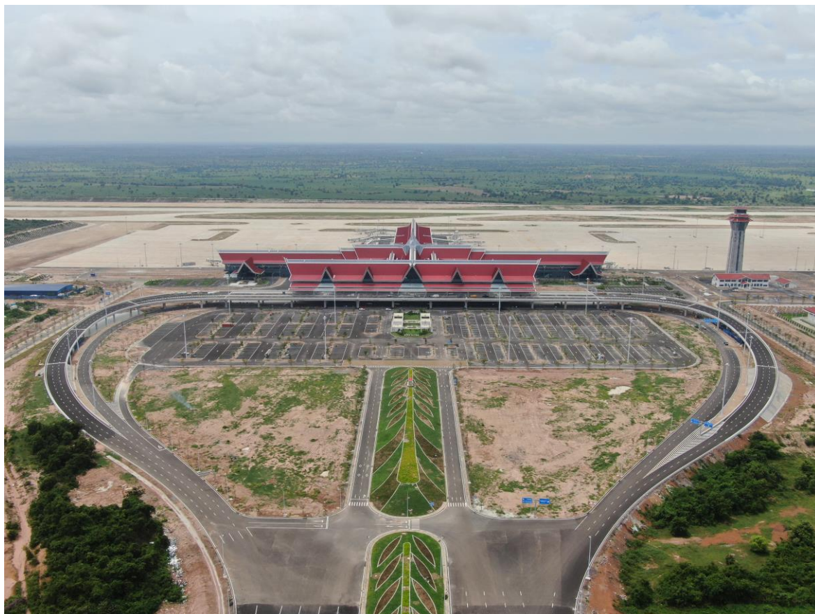
暹粒吴哥国际机场

【与中国的航线】在新冠疫情前，共有22家航空公司（包括16家中国航空公司和6家柬埔寨航空公司）开通柬中往返航班，每周共计415趟航班。2023年2月起，中柬往返航班恢复至疫前的30-40%。执飞的航空公司主要有中国国际航空、中国南方航空、中国东方航空、厦门航空、深圳航空、柬埔寨国家航空、柬埔寨航空和澜湄航空等。